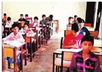
अटल आकासीय विद्यालय में प्रवेश के लिए परीक्षा देने छात्र। संकाय

सुविधा, उच्च तकनीकी से युक्त कक्षाएं, अनुभवी अत्याधुनिक छात्र-छात्राओं के लिए अलग-अलग छात्रावास, नि:शुल्क शिक्षा, भोजन, पाठ्य पुस्तकें, आवास सुविधाएं तथा खेल की सुविधाएं प्रदान की जांगीं। प्रत्येक 80 सीटों के स्थानों में बालकों के लिए 40 सीटों में 20 सीटें अनारक्षित, 11 सीटें अनु पिछड़ा वर्ग, और सीटें अनुभूषित जाति तथा एक सीट अनुश्रुति जनजाति के लिए आरक्षित की गई है। यही आश्रय व्यवस्था 40 बालिकाओं के उपयोग में लागू होगी। राज्य के मानव-विकास के अनुसार दिव्यांग बच्चों (अर्थात् शारीरिक विकलांगता, ब्रह्म वाचन और गृह वाचन) के लिए आश्रय का प्राविधान भी रखा गया है।